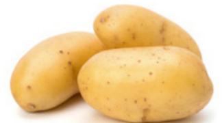
pomme de terre