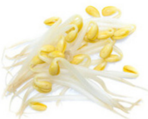
pousses de soja